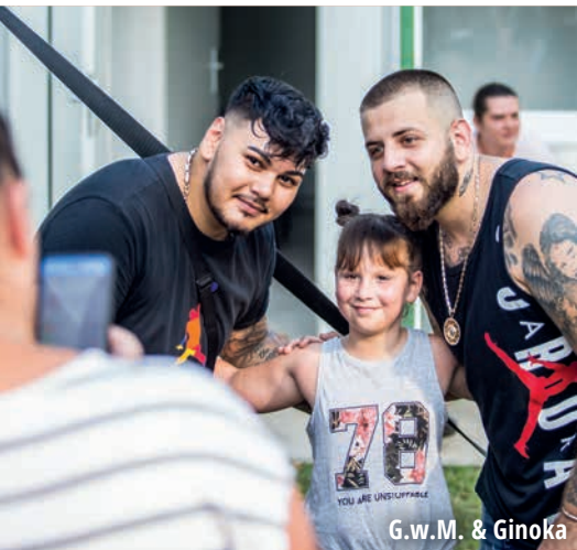
G.w.M. &amp; Ginoka

A XIII. Ősborókás Falunap augusztus 8-án került megrendezésre. Az önkormányzat által több hónapja előkészített és biztosított programsor még az utolsó előtti napon is változott.