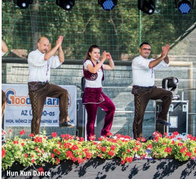
Hun Kun Dance