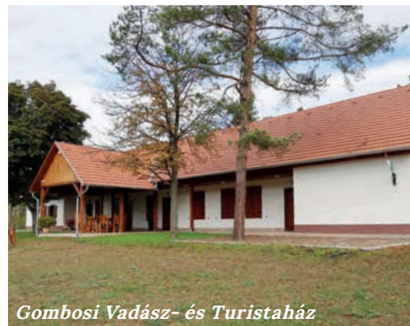
Gombosi Vadász- és Turistaház

henőnél tízóraiztunk, majd egy kellemes ösvény mentén megleltük Aprajafalvát a hatalmas méretű és mennyiségű özlázcombok alatt. Néhány gomba kalapját egy-egy erdei vad meg is rágcsálta, a törpék pedig csak Okoskát hagyták hátra. Kicsit hosszabb szakasz után megálltunk a gyönyörűen felújított Gombosi Vadász- és Turistaháznál . Itt bekukkantottunk az aprócska Hubertusz kápolnába is. De hiába ácsingóztunk egy meleg ital vagy egy friss rétes után, kívül rekedtünk a Gombos pusztai turistaház kapuján. Talán majd legközelebb bejelentkezünk, amint elérhető lesz a nyitvatartás rendje.